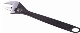
Llave ajustable fosfatizada 12"