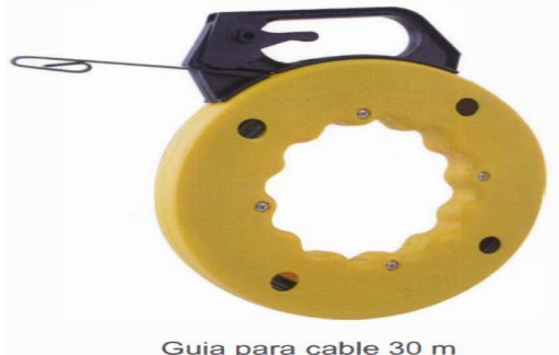
Guia para cable 30 m