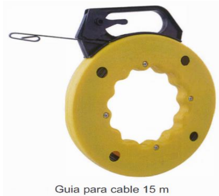
Guia para cable 15 m