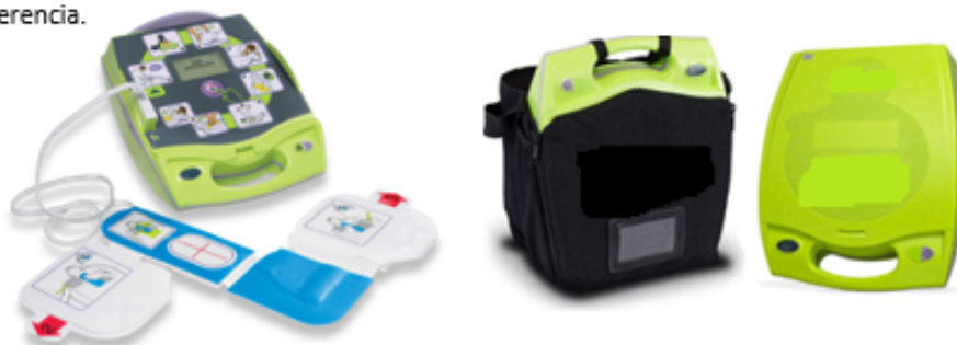
Imagen como referencia.