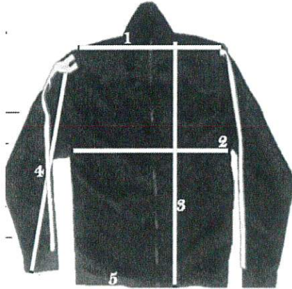
TABLA DE MEDIDAS CHAMARRA