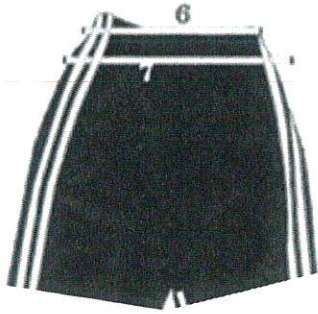
TABLA DE MEDIDAS PARA SHORT