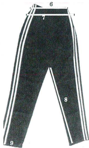
TABLA DE MEDIDAS PARA PANTALÓN