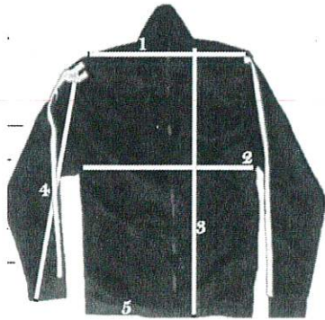
TABLA DE MEDIDAS CHAMARRA